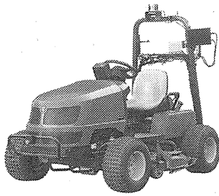
ラフ用無人芝刈り機の試作品

ゴルフ場は一般的に、花道とされるフェアウエーに起伏は少なく、樹木や池などの障害物も少ない。一方、ラフはフェアウエーの外側にあり、起伏が多く、芝の背も高い。さらに樹木や石岩などの障害物が多い。昨秋に試験販売を行い、今秋から本格販売するフェ