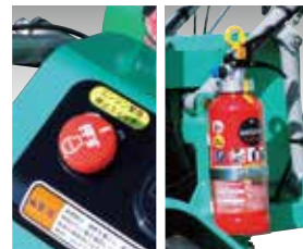
非常時のエンジン緊急停止スイッチ、消火器が標準装備されています。