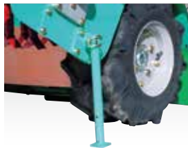
スタンドを装備しているため、ナイフの交換も楽々です。