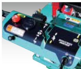
走行にHSTを採用し、ワンレバーで快適に操作できます。