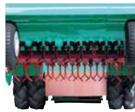
ハンマーナイフは熱処理を施した特殊強靱鋼を使用し、良く切れ、耐久性があります。取り付けはナイフが逃げるフリー構造です。