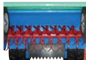
ハンマーナイフは熱処理を施した特殊強靱鋼を使用し、良く切れ、耐久性があります。取り付けはナイフが逃げるフリー構造です。