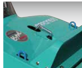
刈高の調節はハンドルで楽々操作できます。