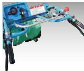
操向クラッチがブレーキと連動しているため、旋回が楽々できます。