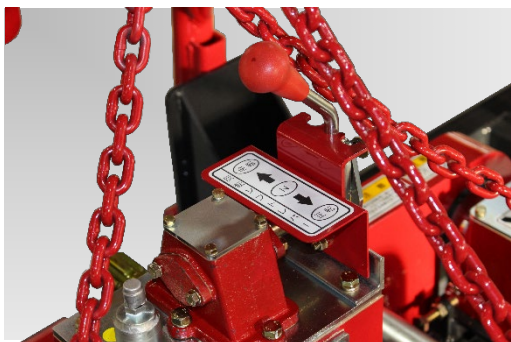
・正転・逆転レバー付です