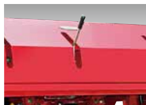
レバー切替で簡単に作業ピッチを変更できます。(2段変速)

各種ティンホルダーを取り揃えておりますので、作業に合わせた選択をすることができます。