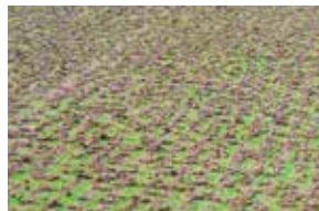
コアの抜けが良く、表面が凸凹になりにくいです。