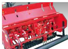
作業部のカバーが大きく開き、十分なメンテナンス領域を確保できるため、清掃やタインの交換も楽にできます。