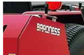
深さ調整は工具なしのハンドル操作で簡単にできます。