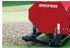
コアの抜けが良く、表面が凸凹になり にくいです。