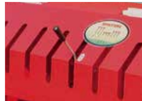
レバー切り替えで簡単に作業ピッチを 変更できます。(2段変速)

各種ティンホルダーを取り揃えておりますので、 作業に合わせた選択をすることができます。