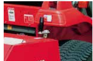
深さ調整は工具なしのハンドル操作で 簡単にできます。