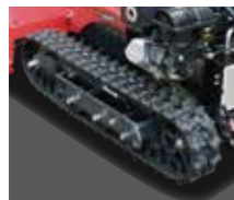
走行部: 左右で独立した 油圧モータ駆動方式