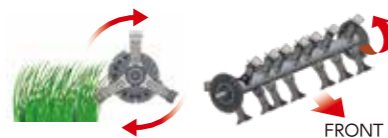
刈取り方式:ハンマーナイフモア