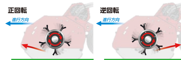
作業効率がよく、長い草丈も刈れ、きれいに刈上がります。