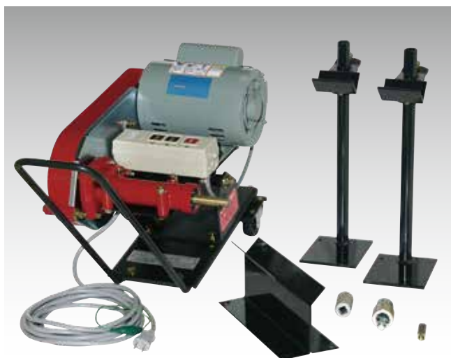
付属の接続金具とジャッキを用いることで、様々な機種に対応できます。