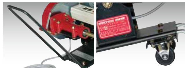
持ち運びに便利なハンドルと、移動に便利な車輪付きです。