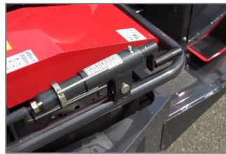
シャッターはハンドルで開閉でき、開度の調整も簡単です。