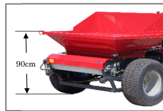
ホッパー位置が低く砂の搬入が楽々できるので、搬入作業の負担を大幅に軽減できます。