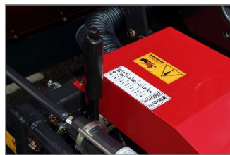
速度調節レバーで走行ペダルの踏み代が調整でき、作業速度を一定に保つことができます。