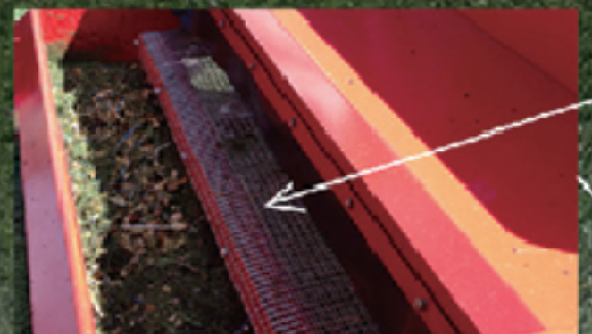
振動ふるい ゴムチップはそのまま落下し、ゴミのみを除去