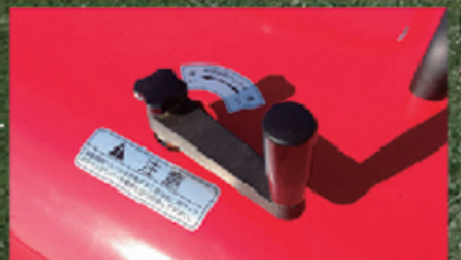
作業深度はハンドルで容易に調整可能