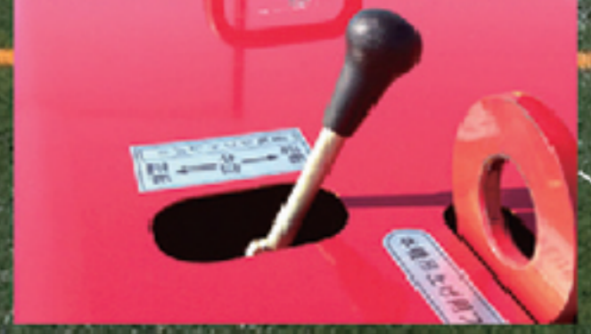
レバーのワンタッチ操作で回転ブラシの正・逆転の切替が可能

ロングパイル人工芝は、55mm前後のパイル丈の人工芝に専用の特殊調整珪砂とゴムチップを充填したものです。人工芝でも使用頻度が増すと繊維カスや落ち葉、芝の倒れやゴムチップの固結によるプレーコンディションの悪化など様々な問題が発生する場合があります。人工芝をいきいきと長持ちさせるためには、定期的なメンテナンスが重要です。