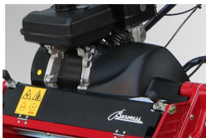
クラッチカバーを、日本刀をイメージしたデザインに一新しました。