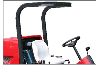
ROPS、シートベルト標準装備なので、万が一の時にオペレーターを保護します。