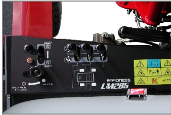
レバー操作で簡単に3連作業、4連作業への変更をすることができます。