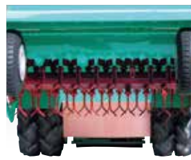
ハンマーナイフは熱処理を施した特殊強靱鋼を使用し、良く切れ、耐久性があります。取り付けはナイフが逃げるフリー構造です。