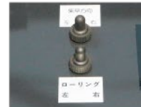
回転スイッチ ローリングスイッチ