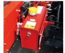
作業機単体の 油圧回路