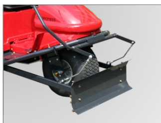
GR165TSには、排土板が付きます。