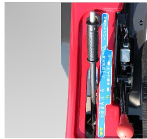
刈高は目安ラベルに合わせ、刈高レバーでワンタッチ調整可能です。(ストッパー付)