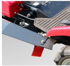
デッキカバーを開閉でき、刈刃の交換やデッキカバー内の清掃・メンテナンスも楽々できます。