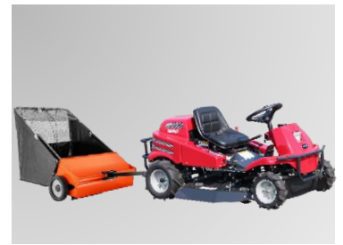
簡易型ローンスイーパー(910)の取り付けも可能です。