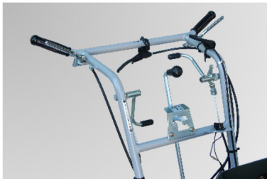
走行速度、作業速度はハンドル部にあるチェンジレバーを切り替えることで調整できます