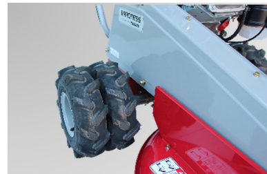
後輪タイヤは、ラグ付きダブル車輪を採用したので、傾斜地で安定した作業ができます。