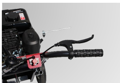
ハンドルのレバーを握ることで簡単に作業深さを設定できます。