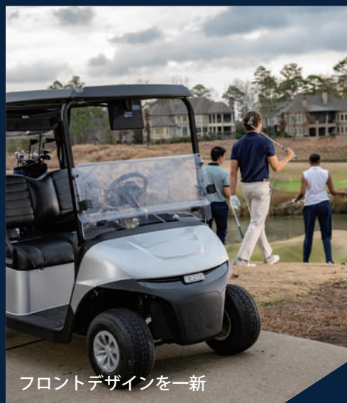
フロントデザインを一新