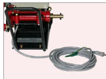
・付属のコードは5mです