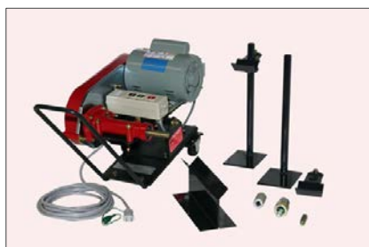
・セット部品一式